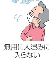
無用 に人混み に入らない