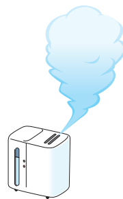
部屋の 適度な湿度

インフルエンザは、主に、咳やくしゃみの際に口から発生する小さな水滴（飛沫）によって感染します（飛沫感染）。普段から“咳エチケット”（①他の人に向けて咳やくしゃみをしない、②咳やくしゃみが出るときはマスクをする、③手のひらで咳やくしゃみを受け止めたら手を洗うことなど）を心がけてください。