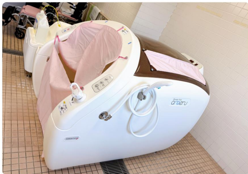
シャワーポッド アラエル