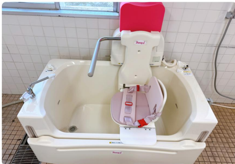
パーソナルケア浴槽 パンジーi