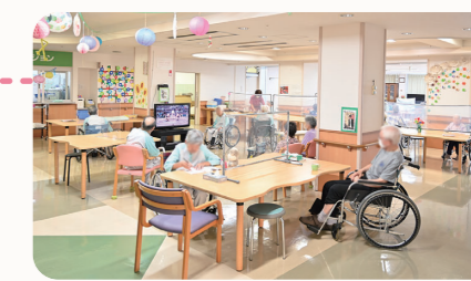
食堂・レクリエーションホール