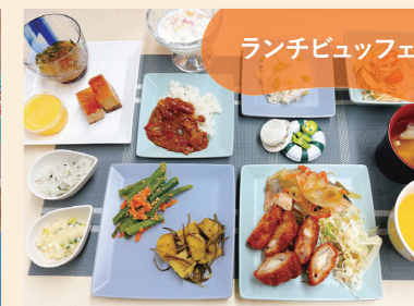
ランチビュッフェ