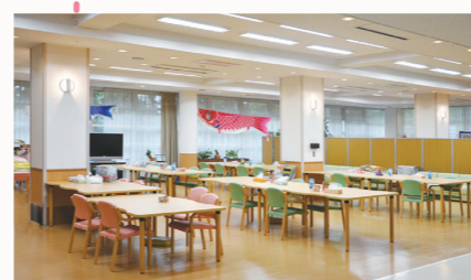
通所リハビリルーム