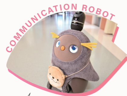
船橋ケアセンターのアイドル LOVOT(ラボット)の“つくしちゃん”